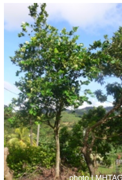
pomélo - fruit défendu