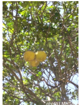
pamplemoussier - chadèk